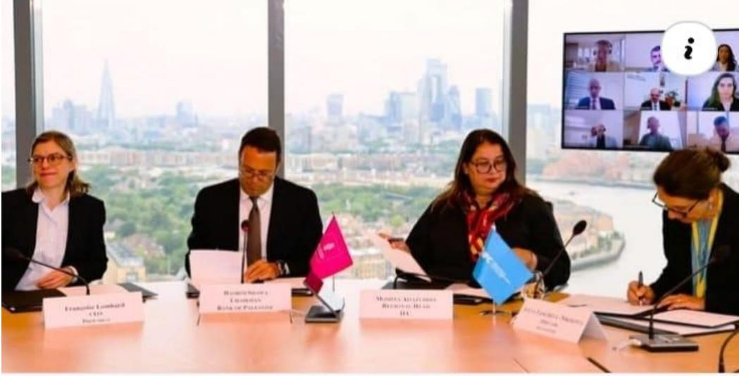
المنشور رقم 4: صورة توثق توقيع اتفاقية ما بين بنك فلسطين ومؤسسة التمويل الدولية وبروباركو وصندوق "سند"